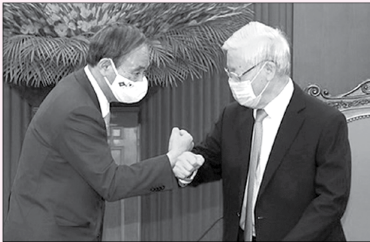
Tổng bí thư, Chủ tịch nước Nguyễn Phú Trọng tiếp Thủ tướng Nhật Bản Suga Yoshihide

Nhà lãnh đạo Việt Nam bày tỏ vui mừng về quan hệ hai nước trong thời gian qua đã có những bước tiến mạnh mẽ, thực chất, hiệu quả với sự tin cậy chính trị cao trên tất cả các lĩnh vực theo tinh thần của "Tuyên bố về Tầm nhìn chung quan hệ Việt Nam - Nhật Bản".