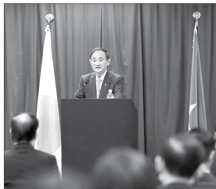
Thủ tướng Suga Yoshihide phát biểu tại Trường ĐH Việt - Nhật (ĐH Quốc gia Hà Nội) ngày 19-10

Meiri Watanabe - ngành khu vực học của Trường Đại học Việt - Nhật, người tham gia buổi đối thoại với Thủ tướng Suga chiều 19-10 - bày tỏ kỳ vọng rằng chính quyền Suga có thể thúc đẩy mạnh mẽ hợp tác giáo dục song phương, đặc biệt là tạo cơ hội học tập về Việt Nam cho người Nhật.